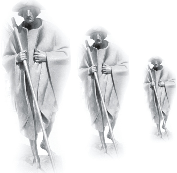
Erstellt von H.W. Hammen, Schornsheim