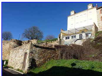
Rückseite der Herberge

Nach Registrierung stempelten wir den Credencial oder fertigten einen aus, so nicht vorhanden, zeigten Habitación (Schlafzimmer), Mantas (Wolldecken), Servicio (Duschen, Toiletten) im EG und im UG Lavadora (Waschmaschine), detergente (Waschpulver), secadora (Trockner), die gut ausgestattete Cocina (Pilgerküche) und den großen Speiseraum (comedor) vor der schönen überdachten Südterrasse überm Hang (teraza, balcón). (Es befindet sich auch eine Kapelle und ein Vortragssaal in der Herberge.)