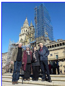
Wir VIER auf der Treppe vor der Kathedrale in Santiago de

Die Öffnungszeiten der Museen sind auch pilgergerecht, nämlich außer über Mittag, auch von 16:00 bis 18:00/19:00 Uhr geöffnet. Es gibt in der Stadt beinahe so viele Apotheken wie Kirchen, ein Krankenhaus und eine Gesundheitsstation (centro de salud), alles fußläufig erreichbar. Im Tourismusbüro gegenüber Gaudi-Palast spricht auch ein Herr deutsch. Überhaupt ist Sprache kein Problem. Ohne Spanisch-, Englisch- oder Französischkenntnisse funktioniert gut die Körpersprache. (Für alle Fälle auf dem Camino und nur deutsch sprechend, sollte man sich die Nummer 902 102 112 notieren, ansonsten wie bei uns 112 für alle Sprachen, wo man auch weiter geleitet wird.)