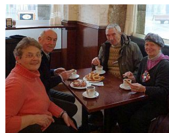
Wir VIER im „El pasaje“ bei „chocolate con churros“

Außer der großen Kathedrale mit Museum und 9 weiteren architektonisch interessanten Kirchen, ist besonders der Bischofspalast von Gaudi zu bewundern. Astorga ist auch für die Schokoladenfabrikation bekannt mit früher 51 und heute noch 6 Herstellungshäusern. Im städtischen Schokoladenmuseum (eine Angestellte ist Deutsche), Nähe Bahnhof, ist alles zu erfahren und zu schmecken. Wahrscheinlich bekommt man deswegen am Rathausplatz von Astorga in „el pasaje“ die beste „chocolate con churros“ zu € 2.50